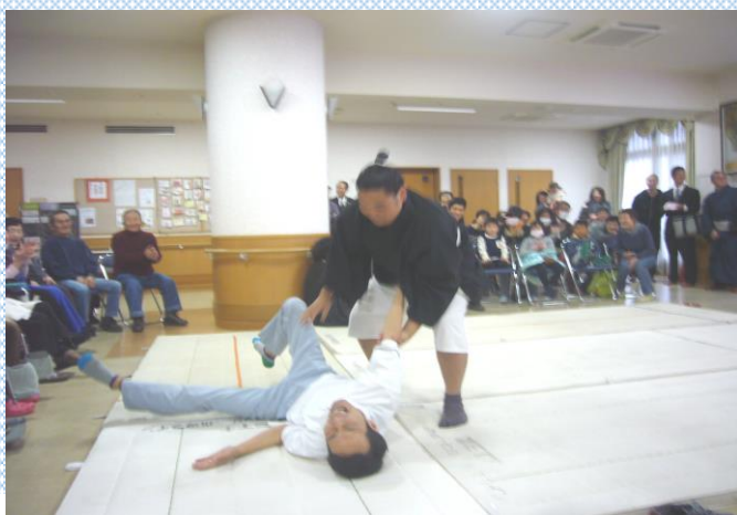
※写真は2016年のものです。