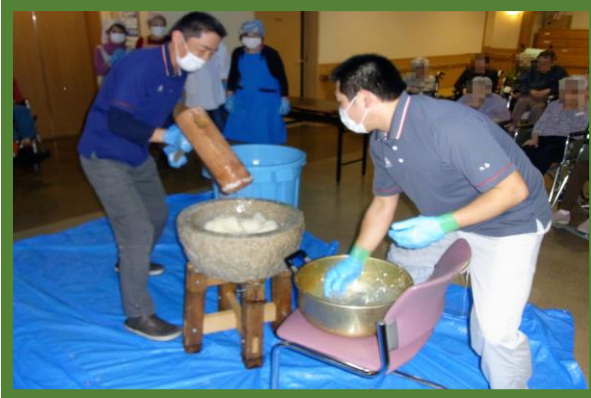
写真は一部加工しています。