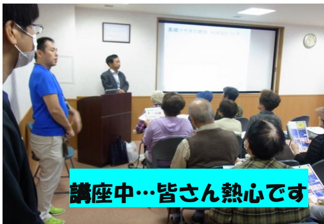
講座中…皆さん熱心です

アンケートにもご協力いただきましたが屋台・講座・展示ともに満足していただけたという内容です。職員一同、ますます地域の皆さまに満足していただけるよう、来年に向けて取り組んでいきたいと思っております。まだ来られたことがないという方は、ぜひ次回いらしてください。健康に関する情報をたくさんご用意してお待ちしております。