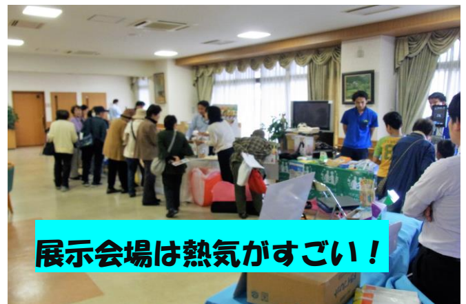
展示会場は熱気がすごい！